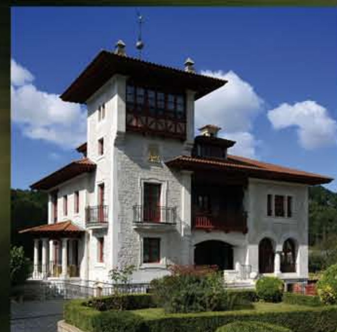
Conservamos dos ejemplos de casas solariegas con su capilla, una situada en Torín, barrio de Valgoín, y documentada a principios del siglo XVI, y otra en Villamayor, el palacio de los Argüelles de finales del siglo XVI, está situado en la carretera general a la salida de Villamayor hacia Sebares.